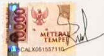
GALANG RAMBU ANARKI